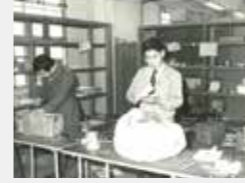
沖縄地区税関(昭和50年)