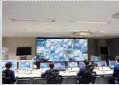
埠頭監視カメラによる取締