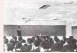
新規採用研修(昭和40年)