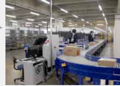
国際郵便物検査装置の導入(令和3年)