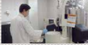
核磁気共鳴装置による分析