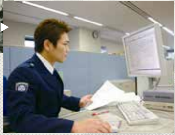
オンライン(NACCS)による手続