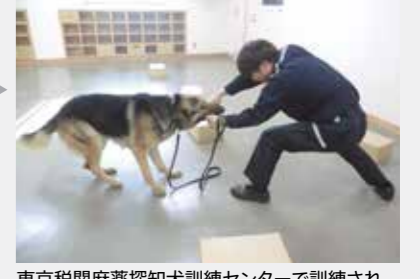
東京税関麻薬探知犬訓練センターで訓練され、現場で活躍