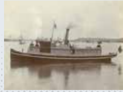
函館税関(大正時代)