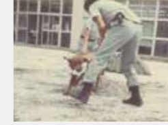
アメリカから導入された麻薬探知犬の訓練風景(昭和54年)