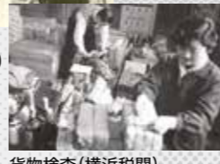
貨物検査(横浜税関)