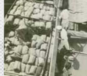
船卸貨物の監視(昭和30年代、東京税関)