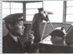
望遠鏡による取締