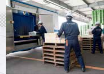
移動式X線検査装置による検査