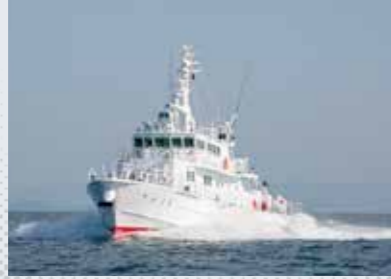
監視艇「りゅうと」(令和2年建造、新潟税関支署)