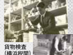
貨物検査(横浜税関)