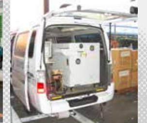
不正薬物・爆発物探知装置(TDS)による検査