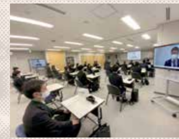
オンラインで受講