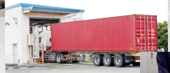
大型X線検査装置による検査