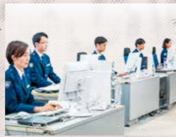
ペーパーレスによる業務