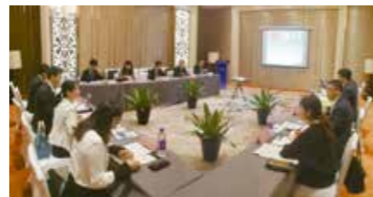
日中韓知的財産作業部会