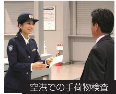
空港での手荷物検査

日本国内で摘発された薬物の約9割が水際での摘発によるものです。更なる水際での取締強化には、皆様の協力が必要です。