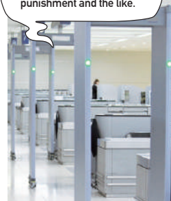
Gate-type metal detector

Japanese Customs is taking measures against gold ingot smuggling, such as stricter inspections, tougher punishment and the like.