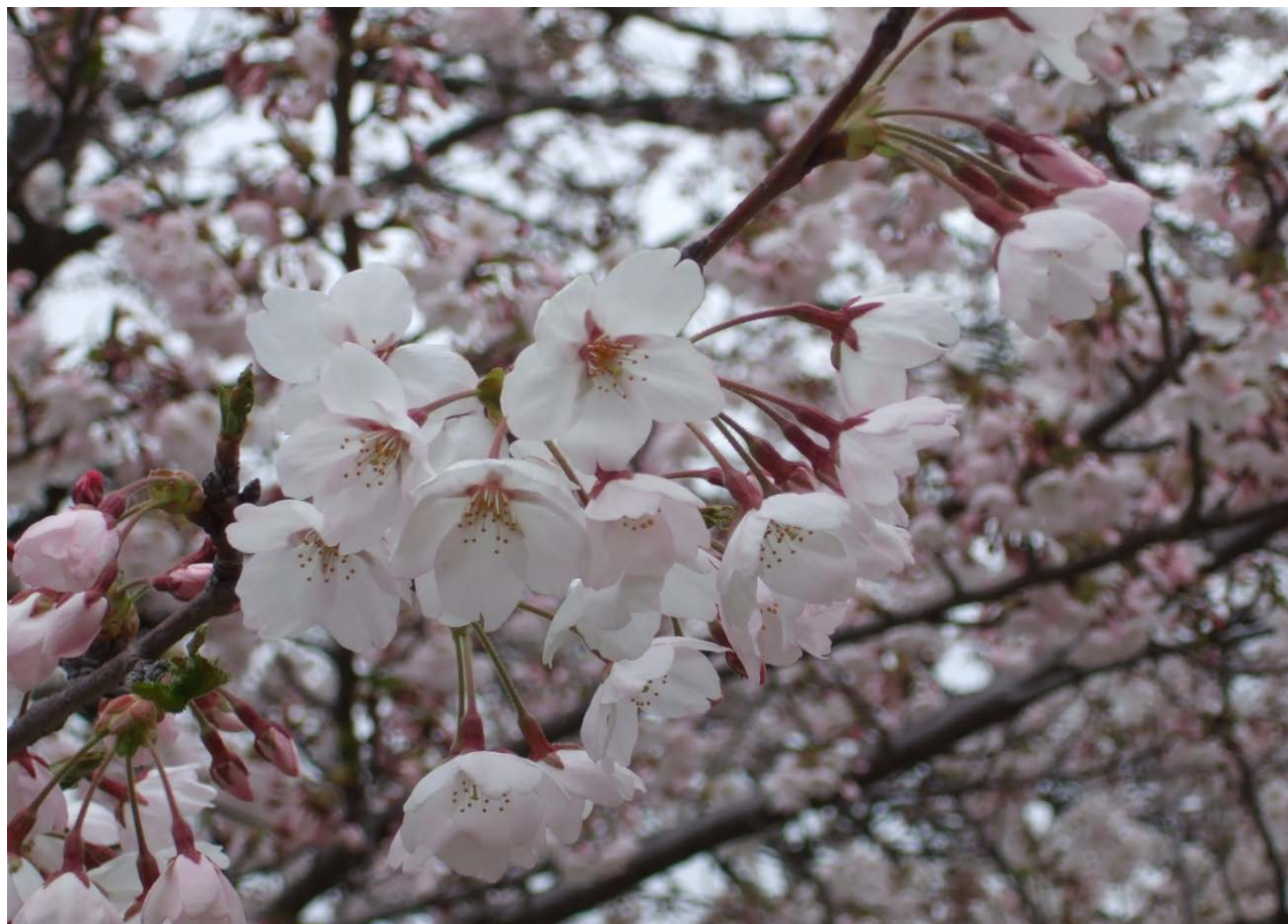
満開の桜 (4/20 小名浜地方合同庁舎にて)