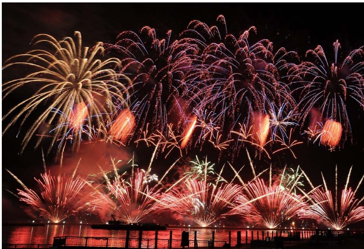
「8/4いわき花火大会」