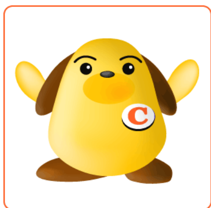
税関イメージキャラクター カスタム君