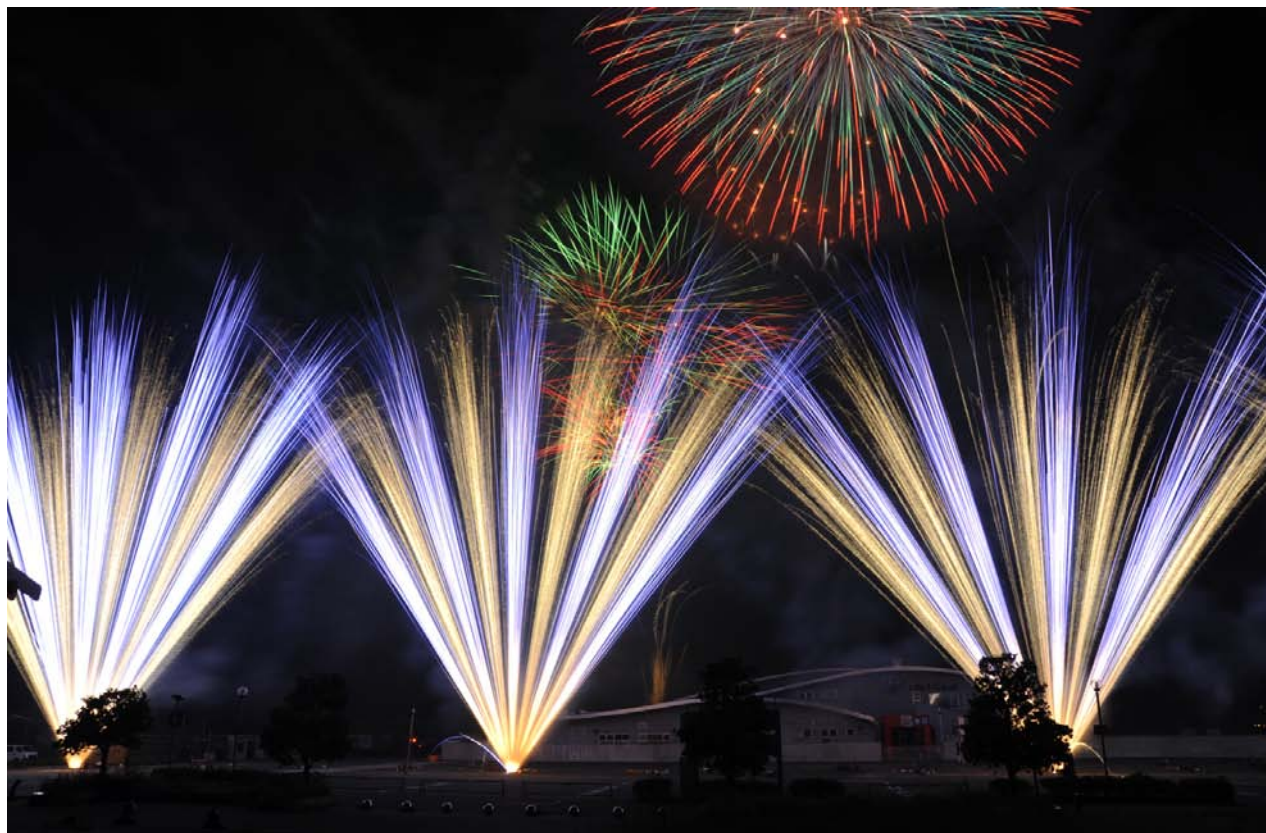
「8/11いわき復興花火大会」