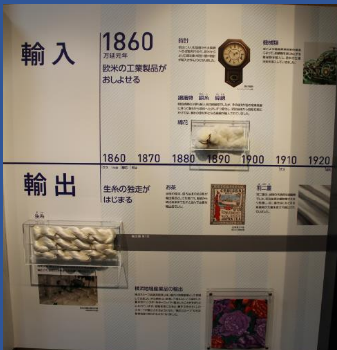
開国後の輸出入品