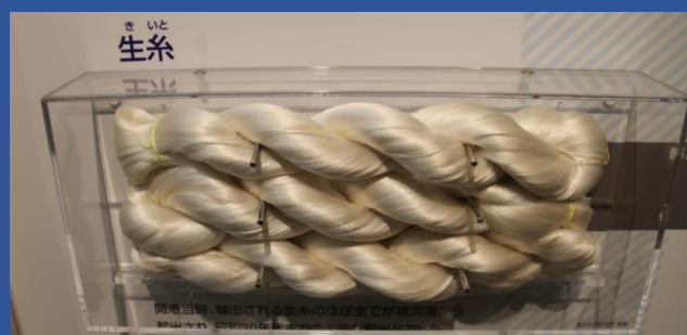
輸出の主要品目であった生糸