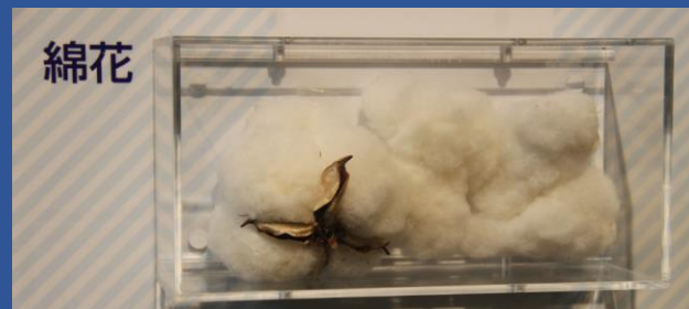
輸入の主要品目であった綿花