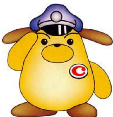
税関イメージキャラクター 「カスタム君」