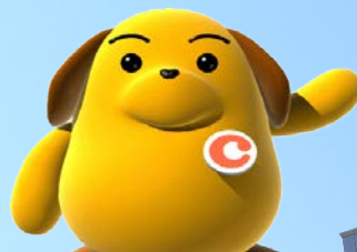
税関イメージキャラクター 「カスタム君」