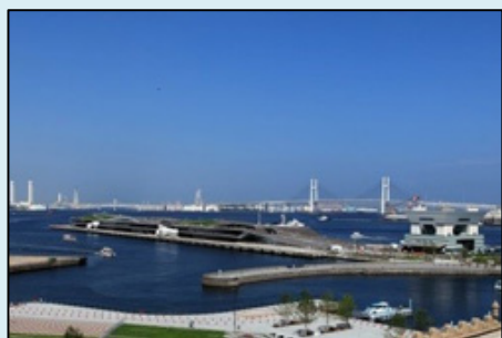
7階ロビーからの展望