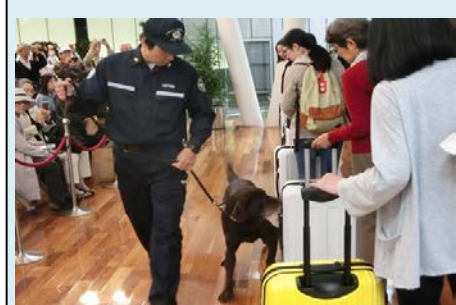
麻薬探知犬デモンストレーション