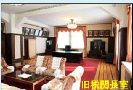
3階保存室(旧税関長室)