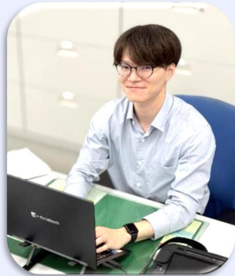
令和2年度採用 一般職大卒（行政） 総務部システム企画調整室

私はネットワーク担当として、東京税関内のネットワークの安定運用のため、日々業務に取り組んでいます。大変な面もありますが、職員からの問い合わせ対応やトラブル・課題解決を通じて実務能力を高められる点に大きなやりがいを感じています。