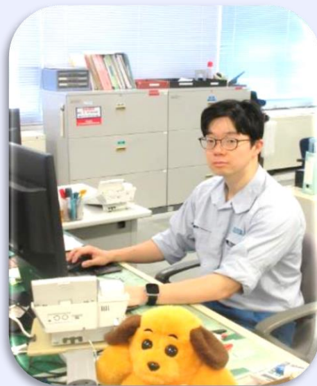
令和2年度採用 一般職大卒（行政） 新潟税関支署直江津出張所

海港における税関の業務は、外国貿易船の監視取締り、輸出入貨物の通関、関税等の徴収、保税蔵置場の取締り等多岐にわたっています。私が勤務する直江津出張所では少数精鋭で、取締・通関・保税などといった幅広い業務を行っています。ある日は船内を隅々まで検査して不正薬物隠匿の発見に尽力しています。また、別の日には輸出入された貨物の検査も行い、申告書通りに適正な品名や税額が記載されているか、他法令の手続きを実施しているか確認します。実務を通じて各業務の関係法令、関係通達等の勉強をして、理解を深めています。時には自治体や近隣学校の要望に応じてイベントに参加し、一般の方に税関の役割や業務を説明しています。