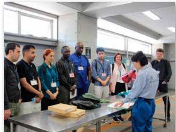
外国税関職員の視察受入

開発途上国税関の改革・近代化に対する支援は、税関手続の調和・簡素化を通じた国際貿易の一層の円滑化、グローバルレベルにおける密輸阻止及びテロ対策等に貢献し、開発途上国のみならず、我が国にとっても安全安心な社会の実現と貿易円滑化等に資する大変有益なものです。さらに、WTO貿易円滑化協定の途上国における円滑な実施を支援する観点も踏まえ、これを実施していきます。