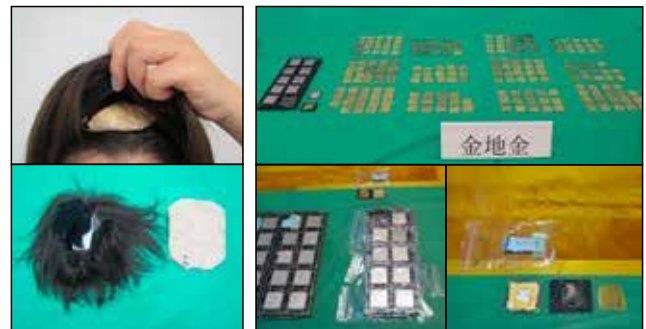
着用していたカツラ内に隠匿