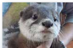
密輸されたコツメカワウソ (2018年)

はく製、毛皮、革製品、漢方薬、印材(象牙)、楽器、化粧品等 Stuffed specimen, Fur goods, Leather goods, Chinese medicine, Material for stamp (Ivory), Musical instrument, Cosmetic, etc.