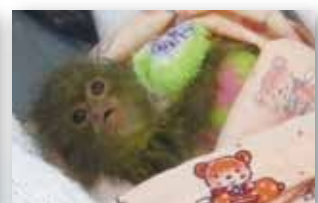
密輸されたビグミーマーモセット (2022年)