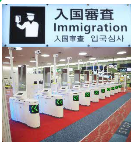
入国審査 Immigration 入国審査 입국심사