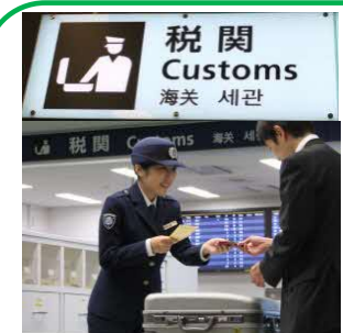
税関 Customs 海关 세관