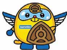
検疫所 イメージキャラクター 「クアラン」

成田空港検疫所・東京出入国在留管理局成田空港支局 動物検疫所成田支所・植物防疫所成田支所・東京税関成田税関支署