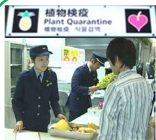
植物検疫 Plant Quarantine 植物检疫 식물검역