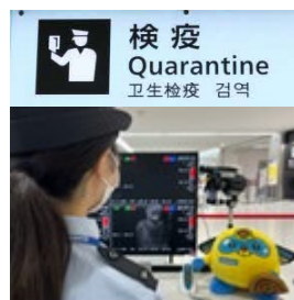
検疫 Quarantine 卫生検査 검역