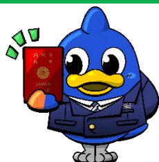
東京出入国在留管理局 マスコットキャラクター 「とりび」