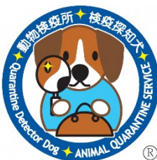
検疫探知犬キャラクター 「クンくん」

https://www.moj.go.jp/isa/immigration/resources/nyuukokukanri07_00168.html