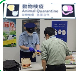
動物検疫 Animal Quarantine 动物检疫 동물검역