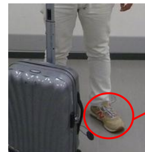
着用靴の中に隠匿