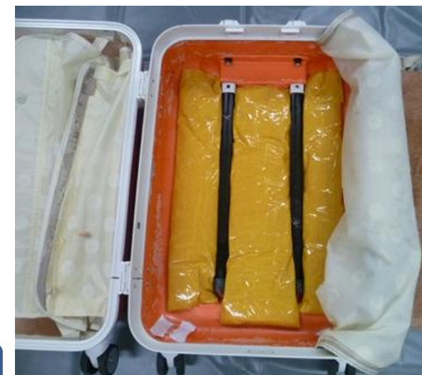
スーツケース底部に隠匿されていた包み