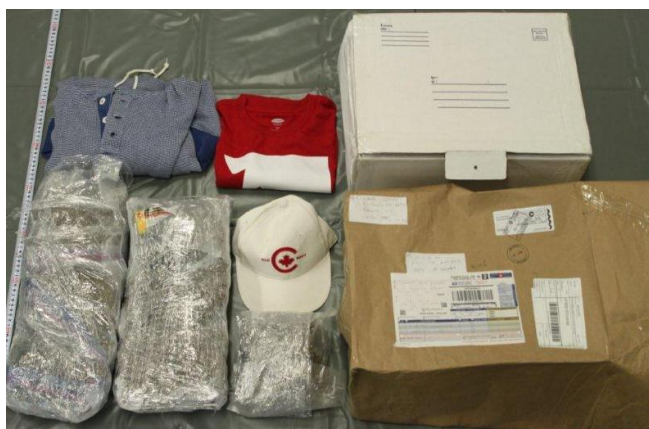
【犯則物件】 大麻草 総重量 1,494.17g