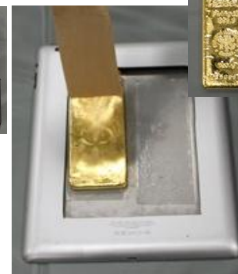
タブレット端末裏面を工作して 隠匿