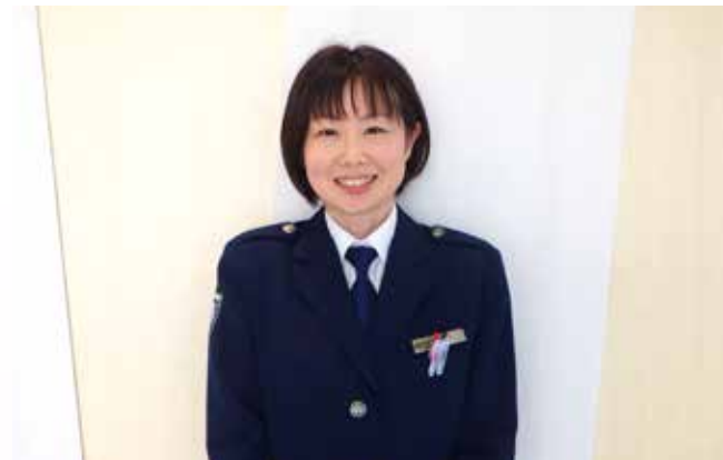
函館税関千歳税関支署総括監視官(総括部門担当)付監視官