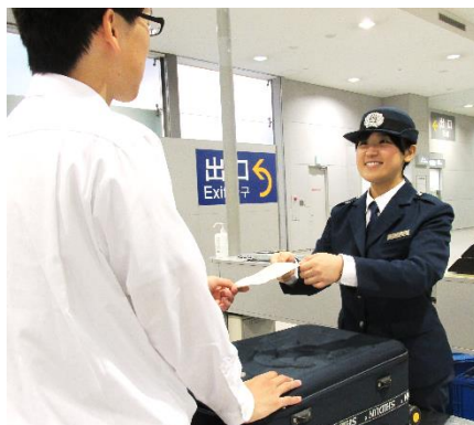
〔適正かつ公平な関税等の徴収〕

税関は港や空港など日本の水際の水際最前線において、社会の安全・安心を脅かす不正薬物、銃器、偽ブランド品などの密輸を取り締まっています。外国の税関当局とも積極的に情報交換を行い、密輸の撲滅に日々取り組んでいます。