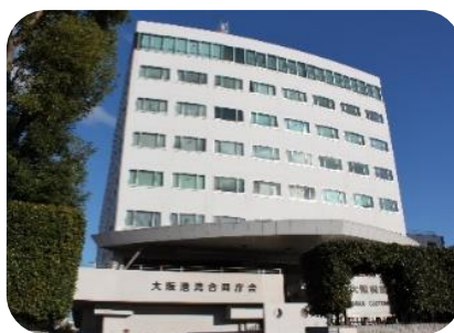
大阪税関本関（大阪港湾合同庁舎）