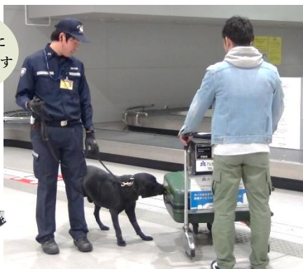
〔安全・安心な社会の実現〕

税関は港や空港など日本の水際の水際最前線において、社会の安全・安心を脅かす不正薬物、銃器、偽ブランド品などの密輸を取り締まっています。外国の税関当局とも積極的に情報交換を行い、密輸の撲滅に日々取り組んでいます。