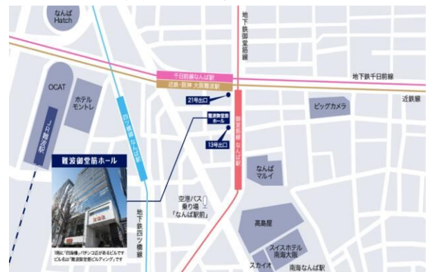
会場案内図(難波御堂筋ホール)

大阪メトロ 御堂筋線 なんば駅 中改札 13号出口から直結 南海本線なんば駅/近鉄奈良線 大阪難波駅 各徒歩約5分