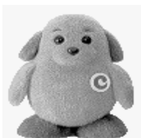
税関イメージキャラクター