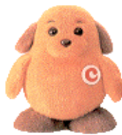
税関イメージキャラクター