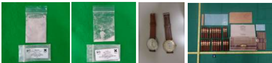
麻薬 3-[2-(ジイソプロピルアミノ)エチル]-5-メトキシインドールの塩酸塩