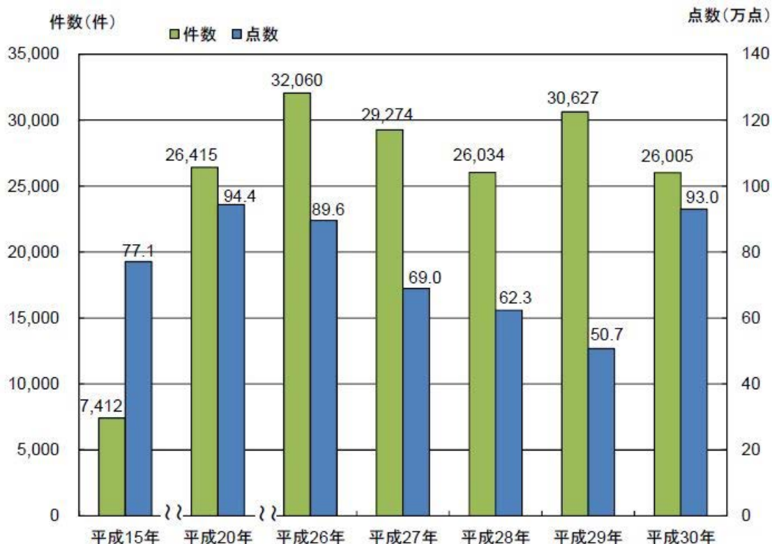
知的財産侵害物品の輸入差止実績の推移

(注) 「輸入差止件数」は、税関が差し止めた知的財産侵害物品が含まれていた輸入申告又は郵便物の数。