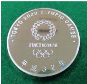
オリンピック記念メダル（商標権）