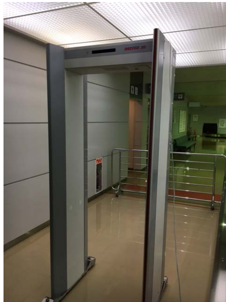
门型金属探测器示例