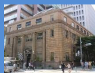
大丸神戸店南第1別館