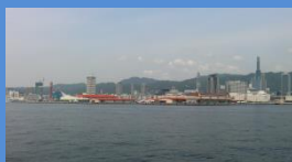
神戸港新港第1～3突堤