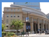
神戸朝日ビルディング