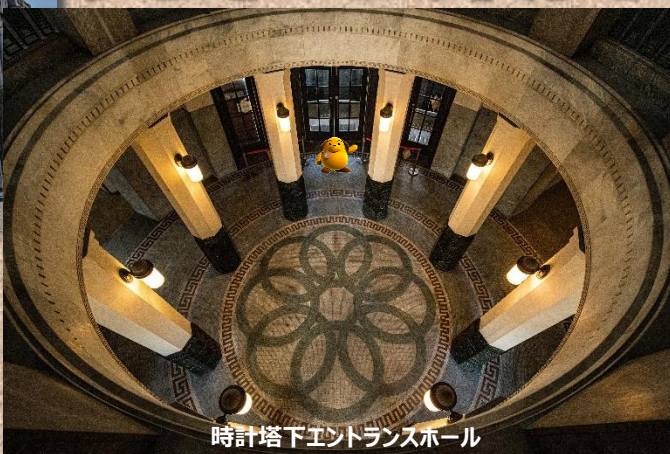
時計塔下エントランスホール