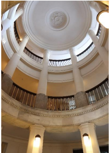
エントランスホール（吹き抜け）