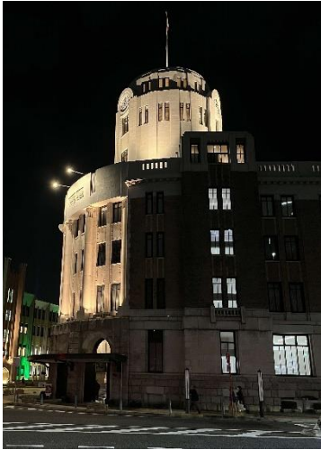
東門（時計塔：ライトアップ）