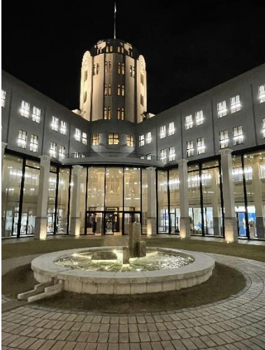
中庭（ライトアップ&夜間開放）