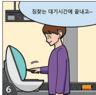
6 수하물 수취 전 대기 시간을 이용하여 수속하실 것을 권장!