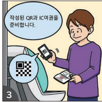
3 QR과 전자여권을 준비하고 공항의 세관검사장에 설치된 전자신고 단말기로 갑니다.