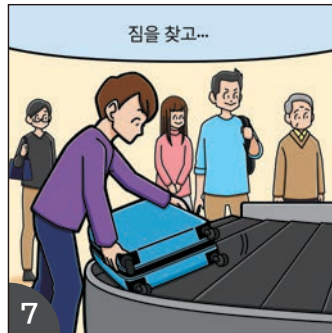
7 짐을 찾았으면 전자신고 게이트로 이동합니다.