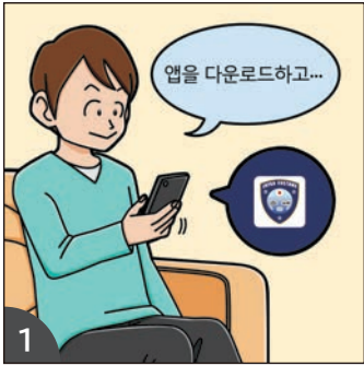
1 세관신고 앱을 미리 다운로드해 놓으면 원활한 수속이 가능합니다.