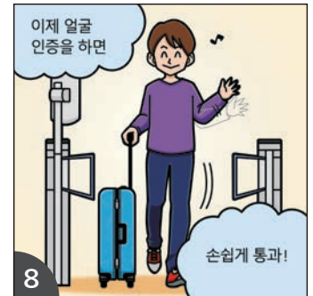
8 게이트에서 얼굴 인증이 되면 원활하게 통과할 수 있습니다.