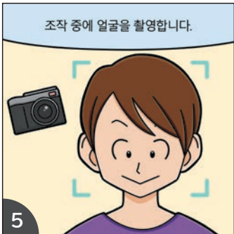
5 전자신고 단말기 조작 중에 단말기의 카메라로 얼굴 촬영을 합니다.