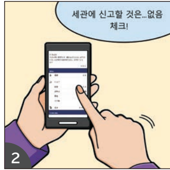
2 앱의 안내에 따라 필요 사항을 차례로 등록하면 QR이 생성됩니다.