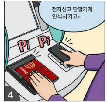
4 전자신고 단말기에 QR과 전자여권의 얼굴 사진면을 인식시키면 됩니다.