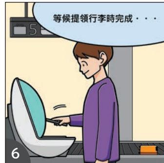
6 推薦在領取行李前的等候時間辦理手續！