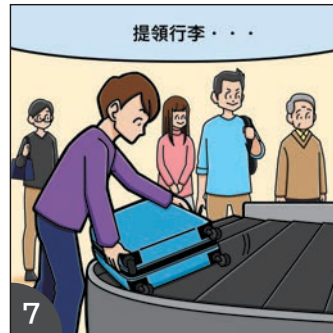
7 提領行李後，前往電子申報通道。