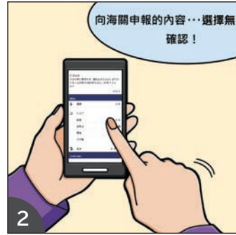
2 依照 APP 的指示依序登錄必填事項後會產生 QR 碼。