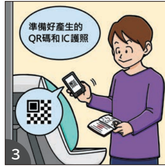
3 準備好 QR 碼和 IC 護照，前往設置在機場海關檢查處的電子申報裝置。