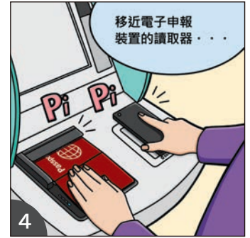
4 只需將 QR 碼和 IC 護照的臉部照片部分移近電子申報裝置的讀取器掃描即可。