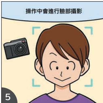
5 操作電子申報裝置時，會以裝置的相機拍攝臉部相片。