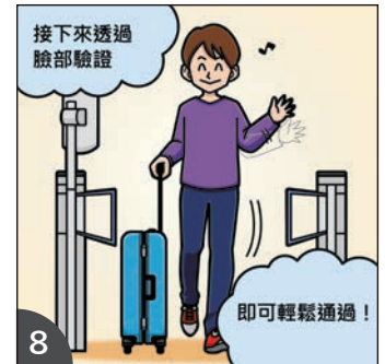
8 在通道進行臉部認證，即可順利通過。