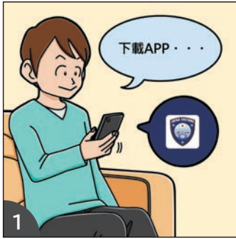
1 事先下載海關申報 APP 即可順利辦理手續。