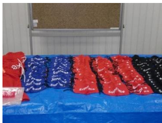
商標権を侵害するマスク等247点

中国から岩手県花巻市宛てに国際郵便物により商標権侵害物品247点を密輸入しようとした日本人を関税法違反で告発した。