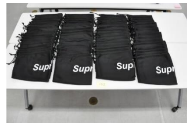
参考:商標権を侵害するネックウォーマー60点