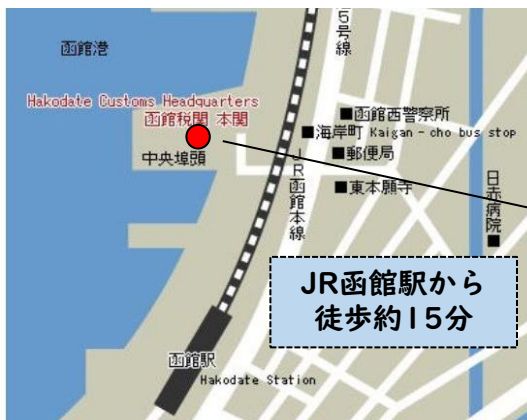
函館港湾合同庁舎