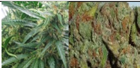
Каннабис, марихуана, конопля