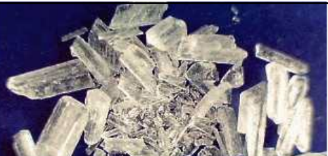
Стимуляторы Метамфетамин Амфетамин

*Употребление каннабиса в Японии и вывоз новых психоактивных веществ(НПВ) не запрещены.