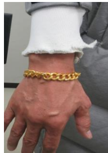
・ ブレスレット状に加工