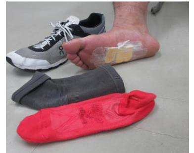
・ 足の裏に貼り付け