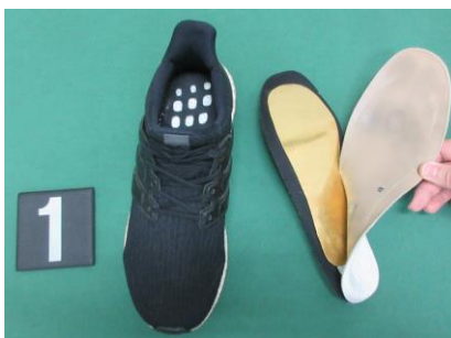
・ 中敷き状に加工