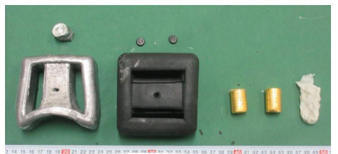
・ ダイビング用ウェイトに加工