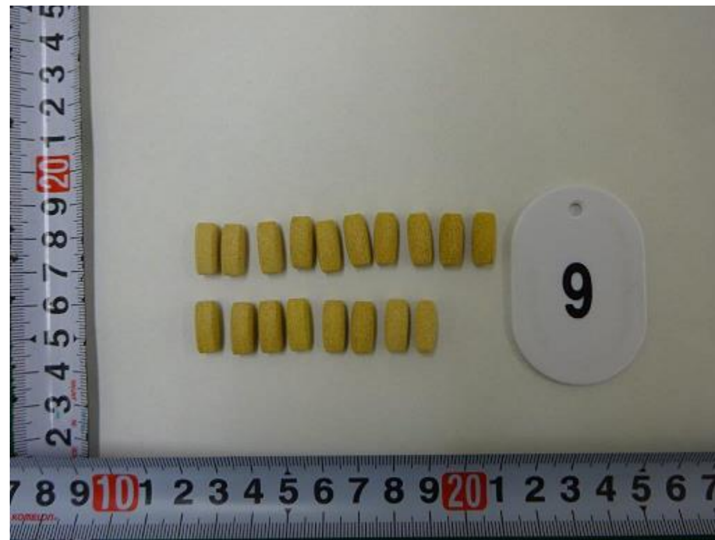
ミトラギニン含有錠剤