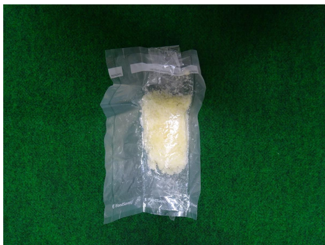
大麻である固形物