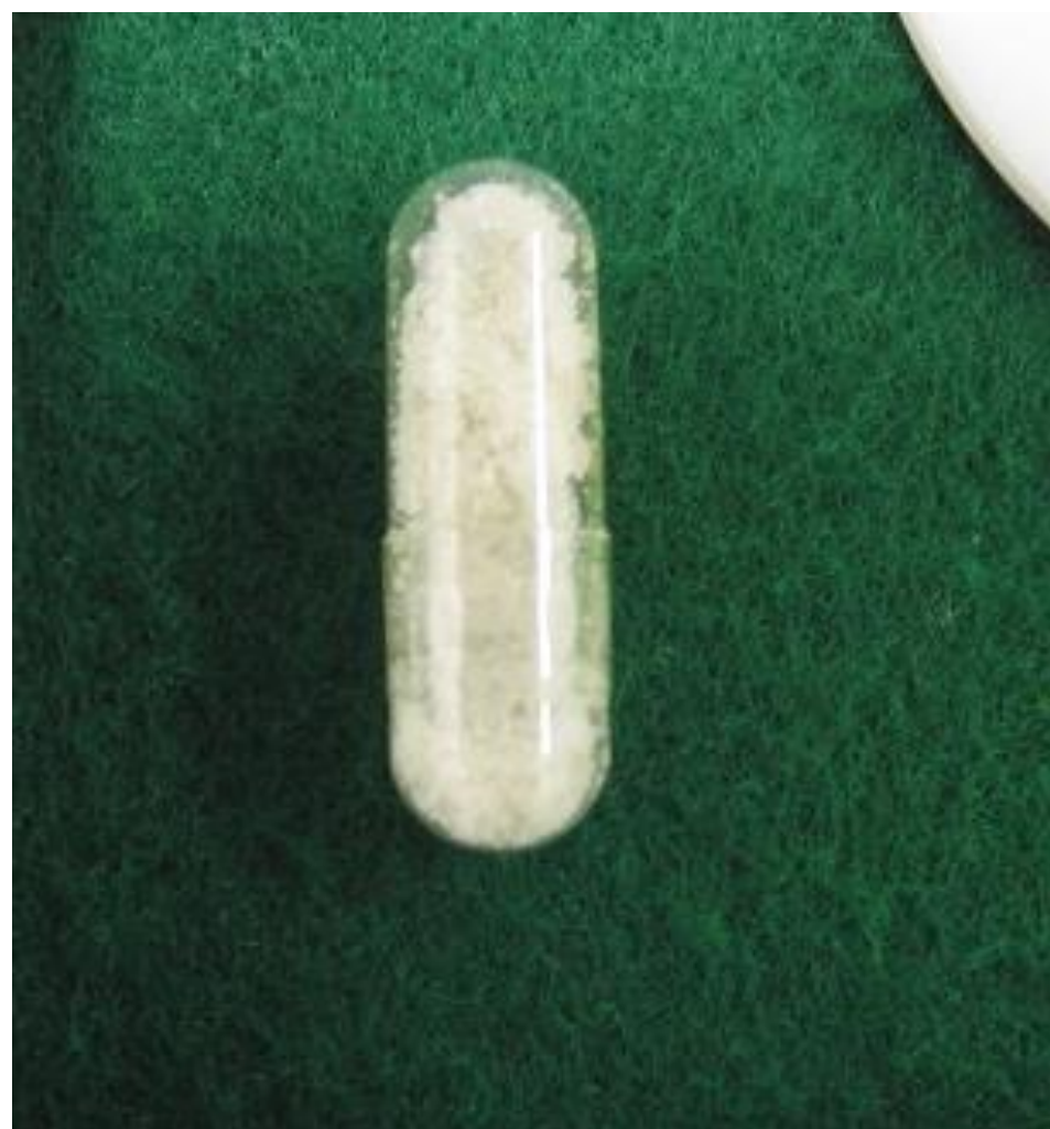
MDMA入り透明カプセル (接写したもの)