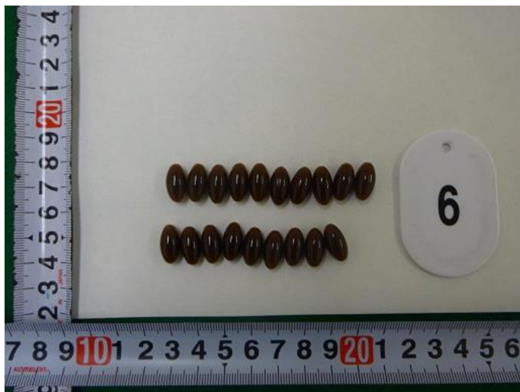
ミトラギニン含有液体 (カプセル入りのもの)

アメリカ合衆国来郵便物から指定薬物である ミトラギニン46.9g を摘発(令和3年5月摘発)