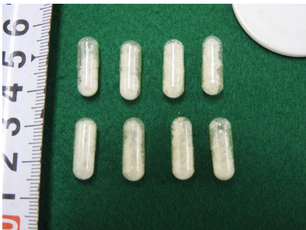
MDMA入り透明カプセル