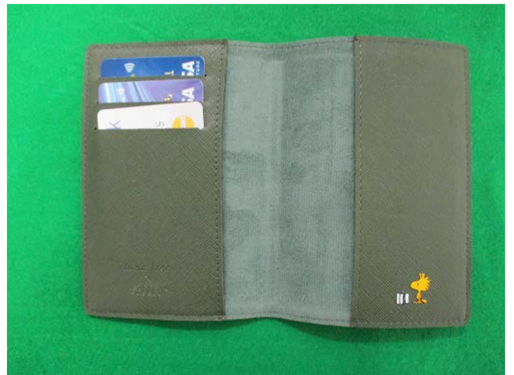
※ パスポートカバー内に3枚隠匿