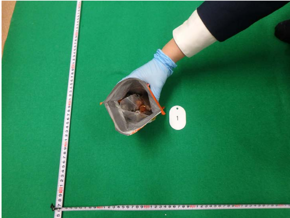
※携帯品内のチョコレート菓子袋内に隠匿 (大麻)

香港来航空旅客の携帯品から大麻5.64g、MDMA0.337g、ケタミン0.063gを摘発 (令和2年2月1日石垣税関支署)