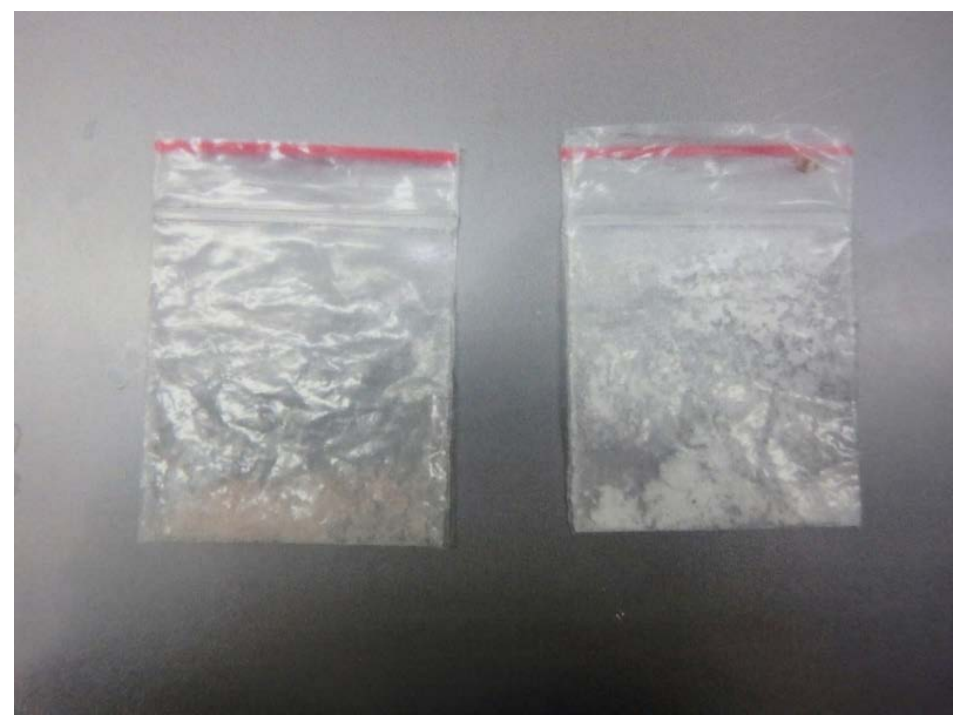
※財布内隠匿(左:MDMA、右:ケタミン)