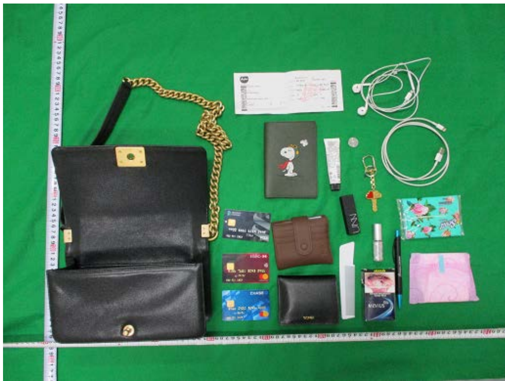
※ 携行するカバン内に3枚隠匿

台湾来航空旅客の携帯品から偽造クレジットカード等35枚を摘発 (令和2年3月18日 那覇空港税関支署)