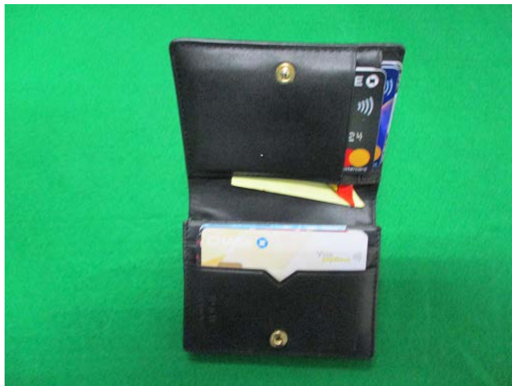
※ 黒色 財布内に9枚隠匿