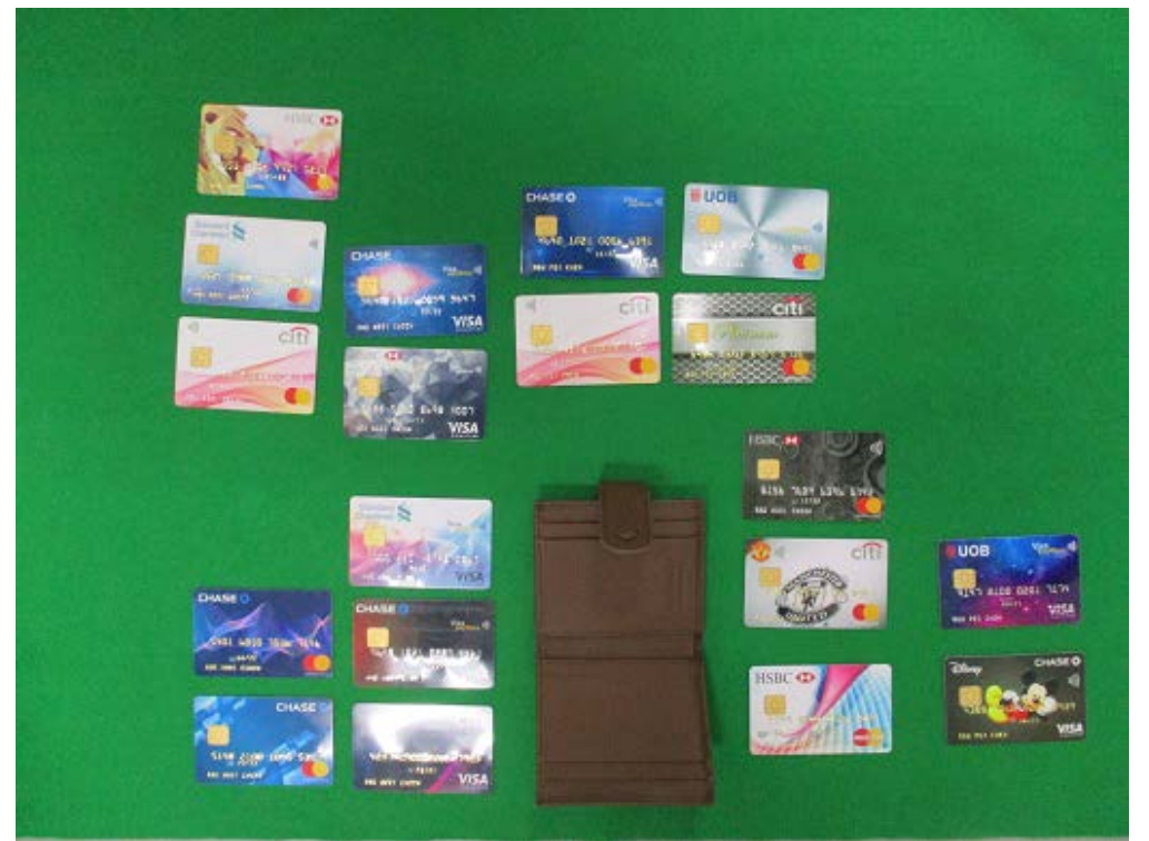
※ 茶色 財布内に19枚隠匿