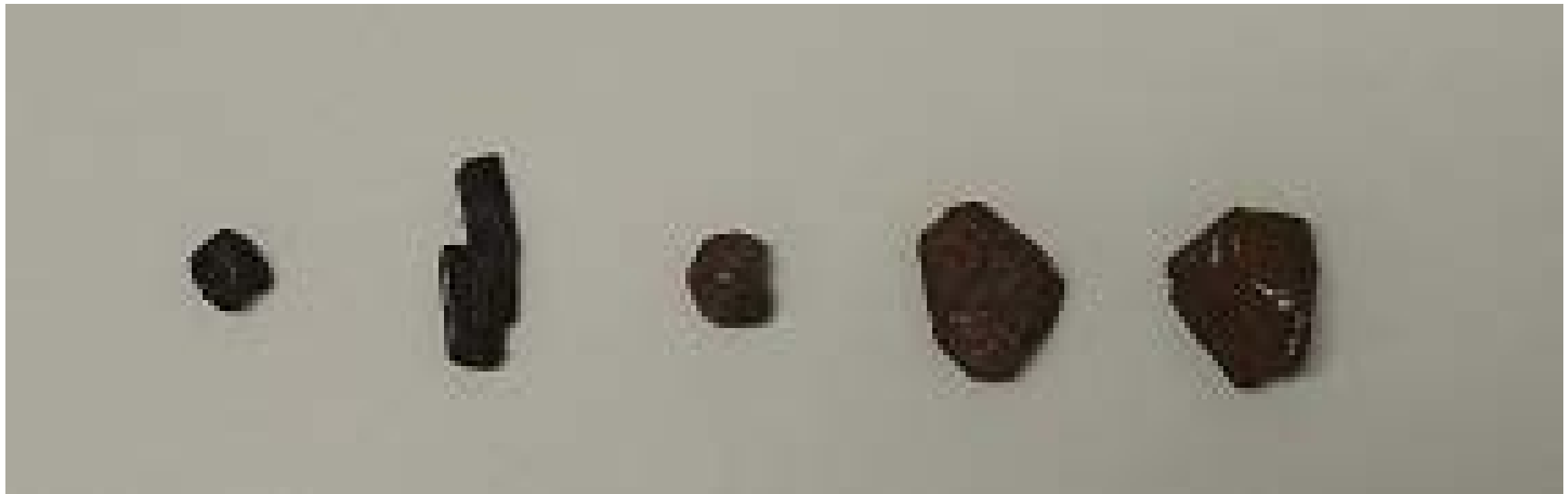
※大麻を並べて拡大したところ