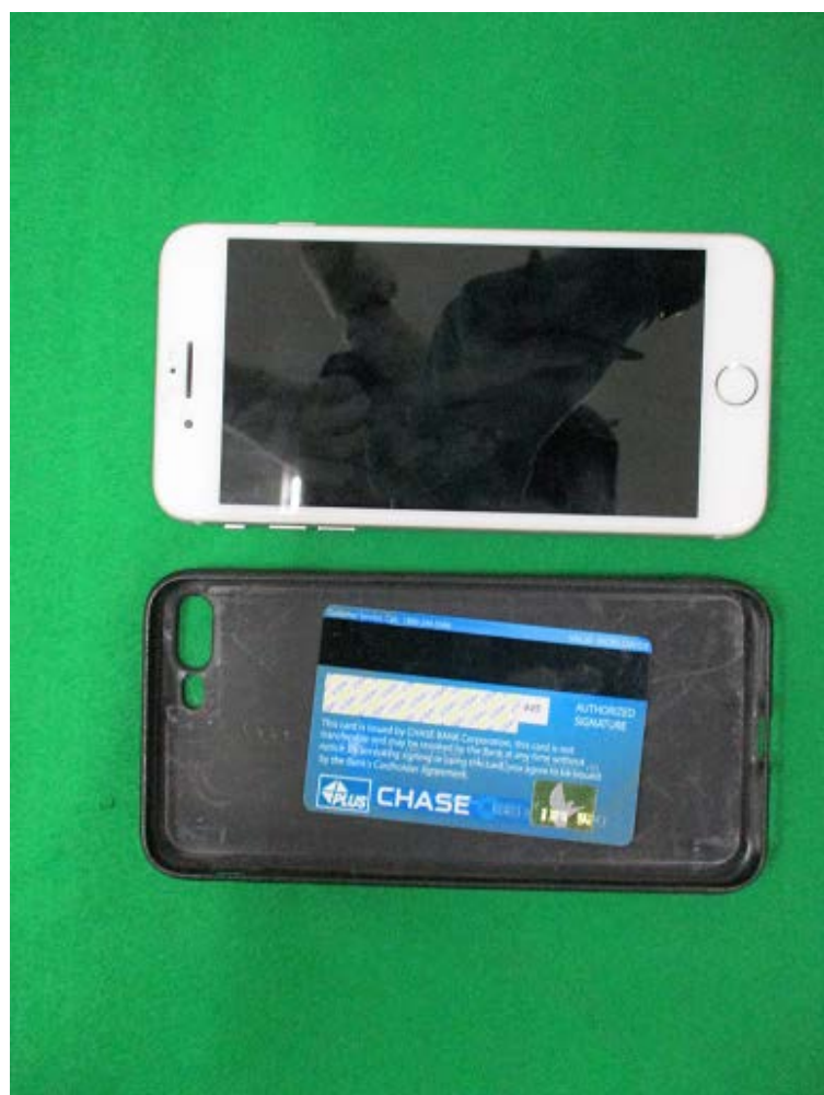
※ スマートフォンカバー内に1枚隠匿