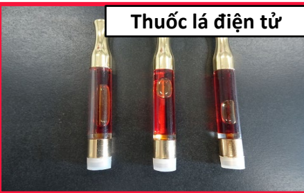
Thuốc lá điện tử