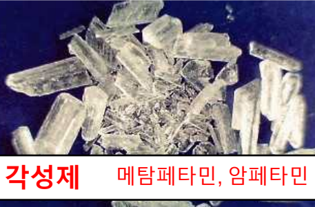
각성제 메탐페타민, 암페타민

*일본 내 대마초 사용과 일본으로부터의 신중 향정신성 물질(NPS) 수출은 현행법상 금지되어 있지 않습니다.