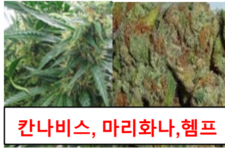
칸나비스, 마리화나, 헴프