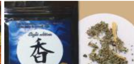
新的精神活性物質