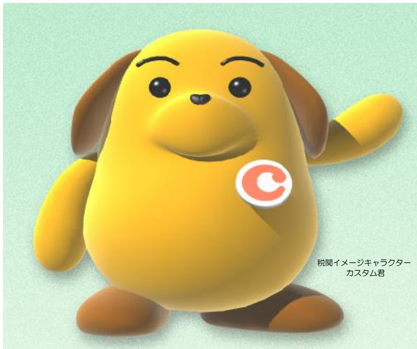
税関イメージキャラクター カスタム君