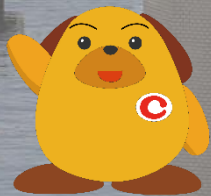
税関イメージキャラクター 「カスタム君」