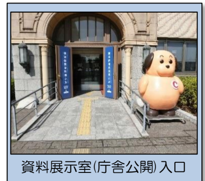
資料展示室(庁舎公開)入口

・昭和9年の創建当時の状態に復元し、マッカーサー元帥も執務したと言われている旧税関長室他3室をご覧頂けます。