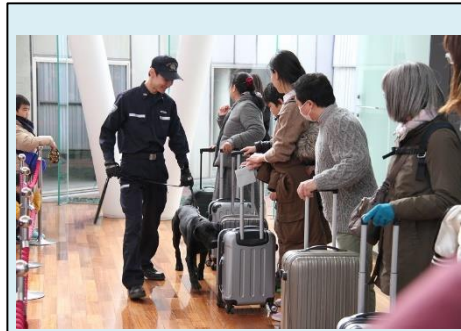
麻薬探知犬デモンストレーション