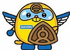
検疫所 イメージキャラクター 「クアラン」

成田空港検疫所・東京出入国在留管理局成田空港支局 動物検疫所成田支所・植物防疫所成田支所・東京税関成田税関支署