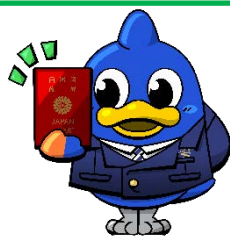
東京出入国在留管理局 マスコットキャラクター 「とりび」