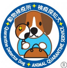
検疫探知犬キャラクター 「クンくん」

https://www.moj.go.jp/isa/immigration/resources/nyuukokukanri07_00168.html