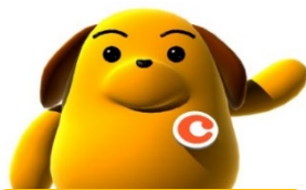
税関イメージキャラクター 「カスタム君」