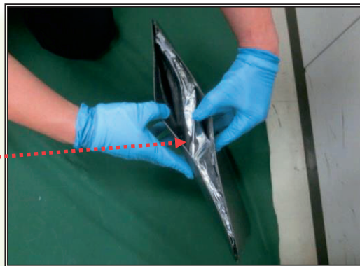
◀ スーツケース底部を二重工作 (成田空港)