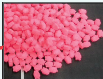
◀ ハンガー内部に隠匿 (成田空港)