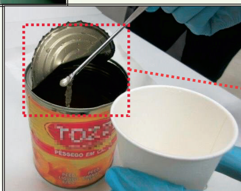
缶詰内に隠匿された コカイン溶液 (成田空港)