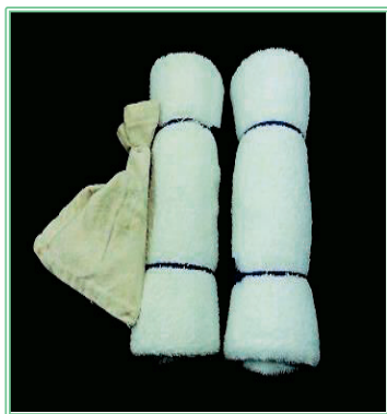
◀遊びに使用する ダミー

A： 麻薬探知犬がダミー(タオルを巻いたもの)を 見つけた場合、ハンドラーはその都度、褒めます。 日頃の訓練において、犬の本能である獲得欲を このダミーに向けさせます。 次に、このダミーと麻薬の入った袋と一緒に 結びつけると、次第に犬は麻薬の匂いとダミーを 関連付けて覚えるようになり、麻薬の匂いを探す ようになります。 (実は犬はダミーを探しているのです)