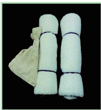
◀遊びに使用する ダミー

A： 麻薬探知犬がダミー(タオルを巻いたもの)を 見つけた場合、ハンドラーはその都度、褒めます。 日頃の訓練において、犬の本能である獲得欲を このダミーに向けさせます。 次に、このダミーと麻薬の入った袋を一緒に 結びつけると、次第に犬は麻薬の匂いとダミーを 関連付けて覚えるようになり、麻薬の匂いを探す ようになります。 (実は犬はダミーを探しているのです)