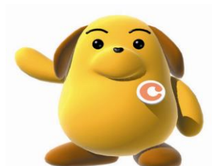
税関イメージキャラクター 「カスタム君」