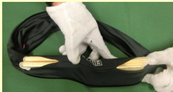
ランニングベルトに隠匿