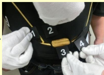
ポケット付アンダーウェアに金塊を隠匿