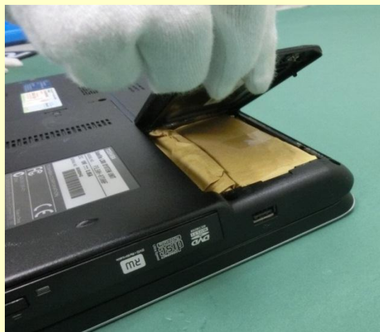
ノートパソコン内部に隠匿