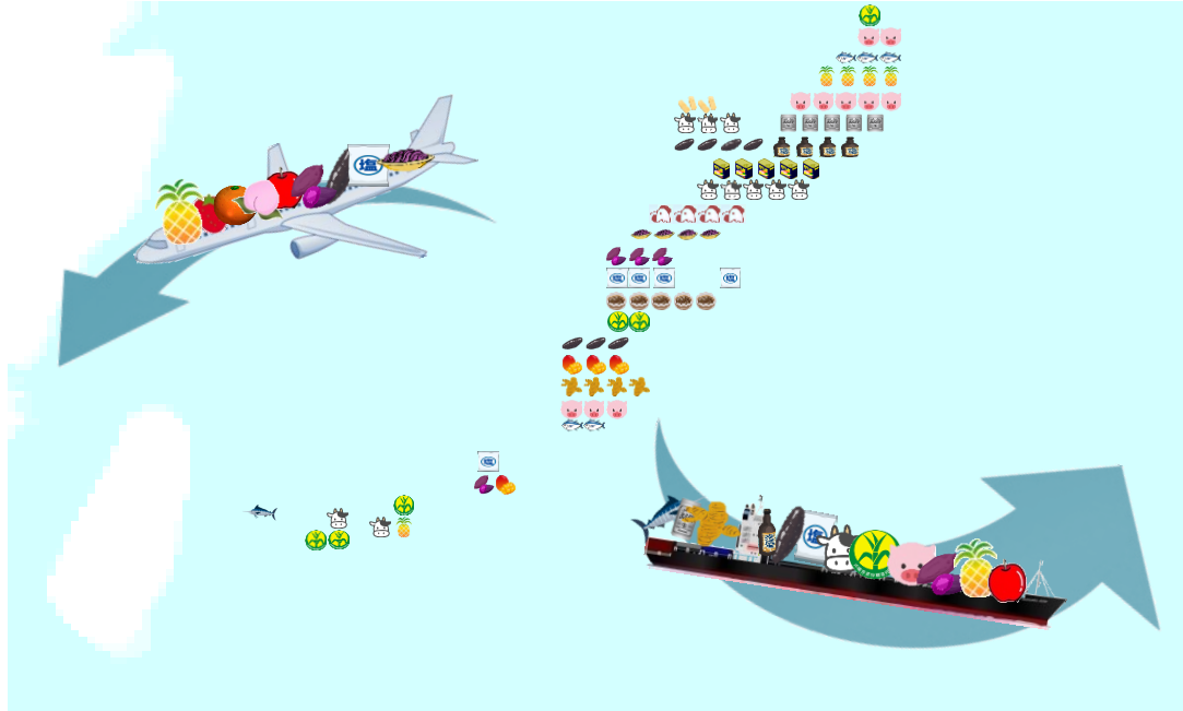
イラストはイメージです。

官民あげて農林水産物の輸出強化に取り組んでいる中、平成28年における沖縄県からの食料品の内、果実の輸出状況はどのようになっていたか振り返ってみます。