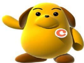
税関イメージキャラクター 【カスタム君】

名古屋港で待っています！ 迷いそうになったら 人事第1係 052 (654) 4025 へTELしてね。