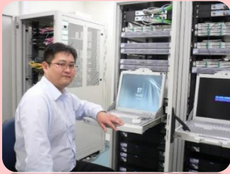
税関システムの維持・管理・開発