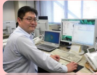
ビッグデータ解析及び活用ツール・システムの開発