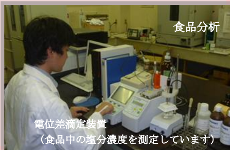
電位差滴定装置 （食品中の塩分濃度を測定しています）