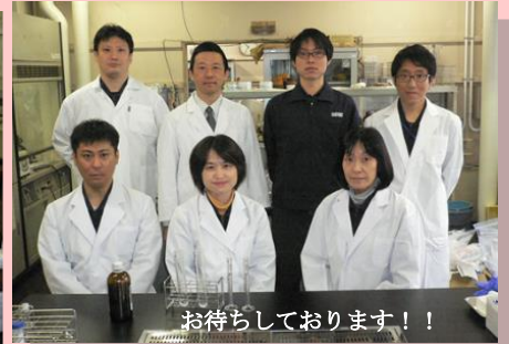
お待ちしております！！