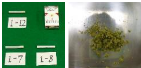
航空旅客が密輸入しようとした大麻。摘発時（左：タバコの状態）、鑑定時（右）