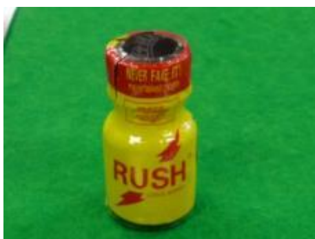
国際郵便物内に隠匿された指定薬物（いわゆる「危険ドラッグ」）