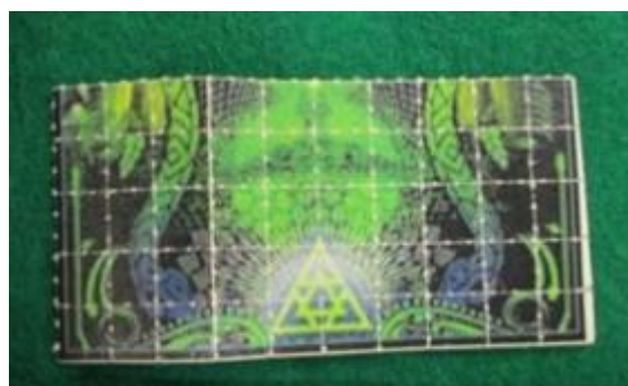
国際郵便物内に隠匿された麻薬を含有する紙片（LSD）

※覚醒剤や指定薬物（いわゆる危険ドラッグ）をはじめとする不正薬物は、それを使用する人間の精神や身体をボロボロにし、人間が人間として生活を営むことが出来なくなるだけでなく、場合によっては死亡することもあります。また不正薬物の乱用による幻覚・妄想が、殺人や放火などの凶悪な犯罪や交通事故を引き起こすなど、使用した本人のみならず、周囲の人、さらには社会全体に対しても取り返しのつかない被害を及ぼしかねません。