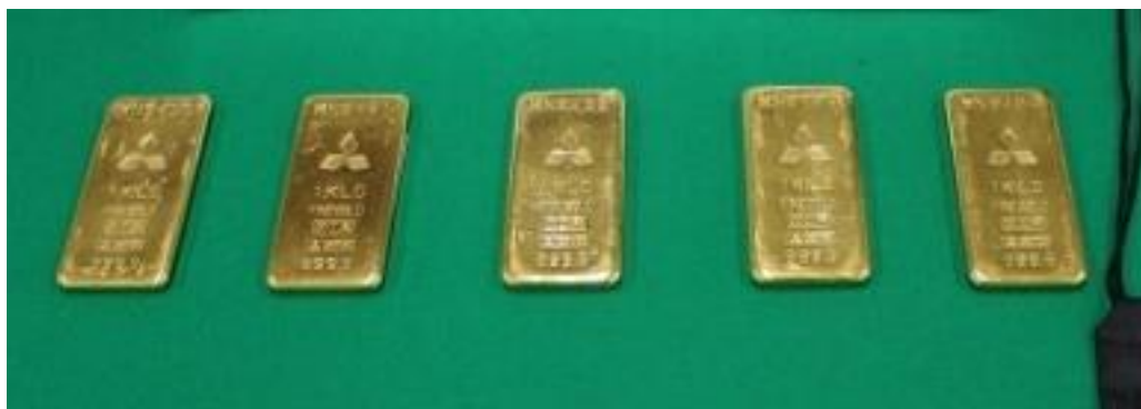
密輸入のため航空機内のトイレに隠匿された金塊

※金（金地金）を外国から輸入する場合には、税関に申告し、納税する必要があります。