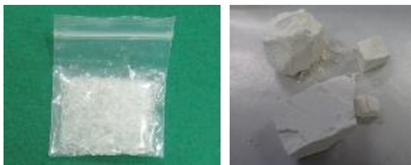
航空旅客が密輸入しようとした覚醒剤（左）とヘロイン（右）