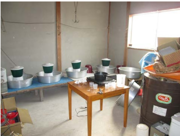
← 危険ドラッグ製造工場 麻薬粉末を工場で加工していた。