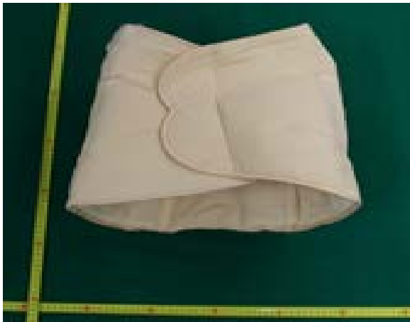
腰部分に巻いていたコルセット

平成26年10月、中部国際空港において、南アフリカ共和国から到着した南アフリカ人女性から、腰部分に巻き付けて隠匿していた覚醒剤 2,270.68g を摘発した。