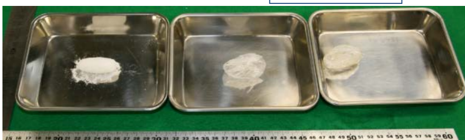
↓ 1 塊を解体