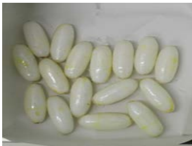
↑ 嚥下隠匿 21 塊の一部