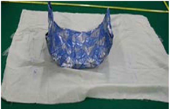
コルセットから取り出した状態