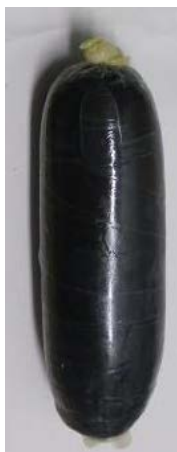
体腔内隠匿 1 塊

平成 26 年 10 月、中部国際空港において、タイ王国から香港を經由して到着したタイ人女性が体腔内隠匿（1 塊）及び嚥下隠匿（21 塊）していた覚醒剤 357.213g を摘発した。