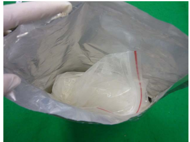
↑ XLR-11 重量約 500g